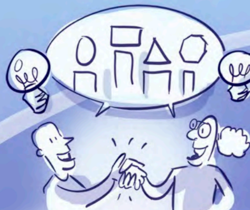
Jokainen on ainutlaatuinen