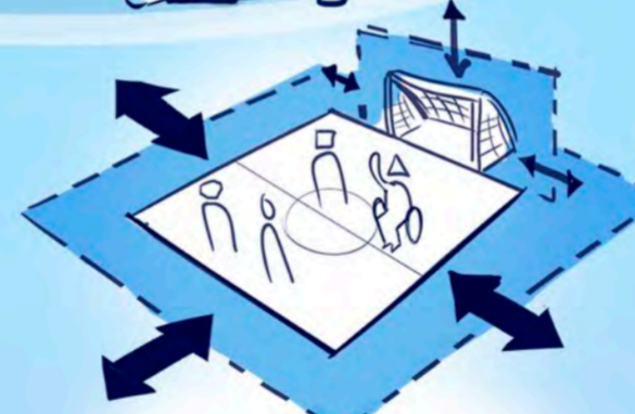
Jokainen voi osallistua