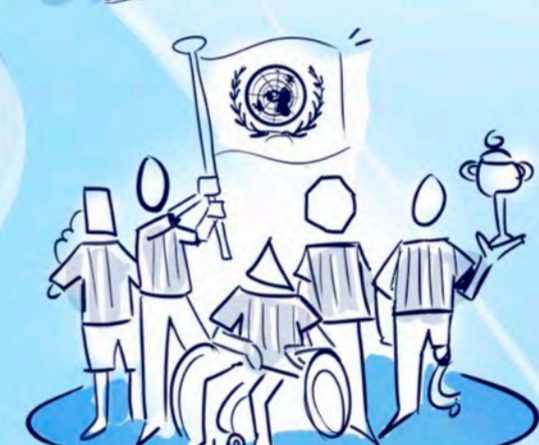
Yhtenvertaisuus ja yhtäläiset oikeudet