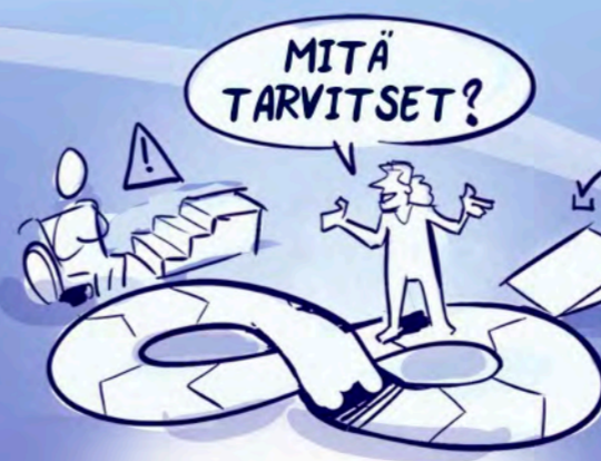
Inkluisio on jatkuva prosessi